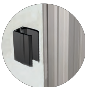
OPTIONAL STAFFA 45-50 PER FISSAGGIO LATERALE