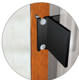
OPTIONAL STAFFA 45-50 PER FISSAGGIO FRONTALE

N.B.: Larghezze massimo fino a 600mm Altezze 1400mm.